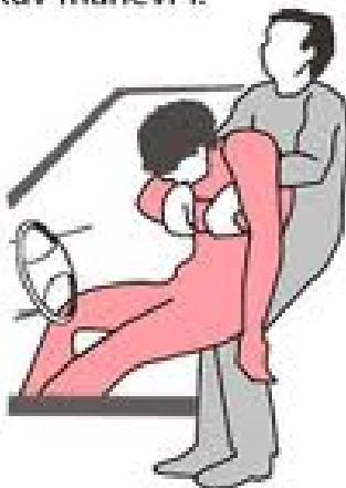
Rautekův manévr I.